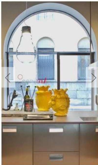
1 - 3 LO SHOWROOM ARCLINEA IN CORSO MONFORTE A MILANO DOVE SI È SVOLTO L'EVENTO IN CUCINA CON POLLOCK

Ad affiancare le due mostre un percorso interattivo, con touch-screen, video e riproduzioni in 3D, in parte realizzato in collaborazione con NEC, documenta le fasi di conservazione dell' opera Alchimia , di Jackson Pollock, nel corso di oltre un anno all'Opificio delle Pietre Dure di Firenze, e ora esposta accanto al Murale.