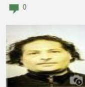
Assaltarono il «Marriott», arrestati quattro della 'ndrangheta