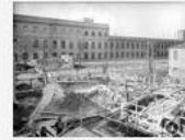
Le foto dell'archivio Ater